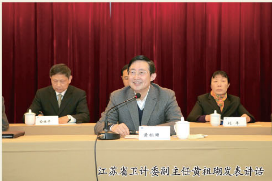
江苏省卫计委副主任黄祖瑚发表讲话