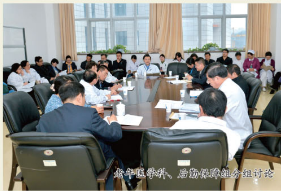
老年医学科、后勤保障组分组讨论

培养好人才。注重分层分类。医疗方面，制订实施专业、细化的适应多学科融合趋势的人才培养方案；加强青年人才基本功训练，鼓励中年人才开展适宜技术再创新，支持高级专家推进重大技术科学化。科研方面，深入推进“临床研究转化骨干培育计划”，致力打造一批高层次专业化的优秀研究型医生和临床科学家，成为各学科临床研究与应用