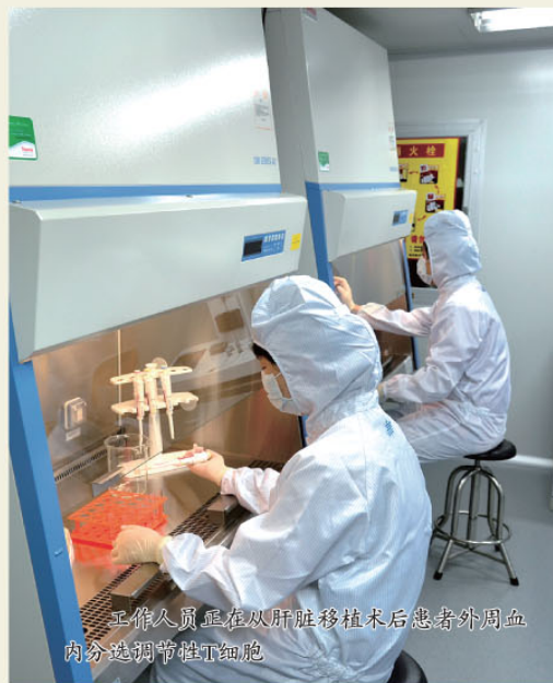
工作人员正在从肝移植术后患者外周血内分离调节性T细胞

“把患者自体细胞提取出来，在体外培养并‘训练’它们‘不认生’，教会它们认识植入器官以后，再回输到患者体内去管控战斗部队。”王院士团队中的吕凌副教授介绍，人体的免疫系统中存在着一种调节性T细胞，其作用相当于“宪兵部队”，可以管控“战斗部队”。通过对患者自体细胞进行体外培养，生成“认识”捐献器官的、“私人定制”的调节性T细胞，再回输到患者体内，则可以使人体对移植“认异为己”，避免排异反应，从而免除患者终身服用免疫抑制药物的痛苦。（陈思宇 蔡心轶）