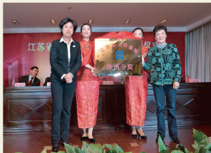
3月6日上午，江苏省人民医院徐州分院揭牌仪式在徐州市第三人民医院举行，这标志着徐州市第三人民医院和我院正式结合成